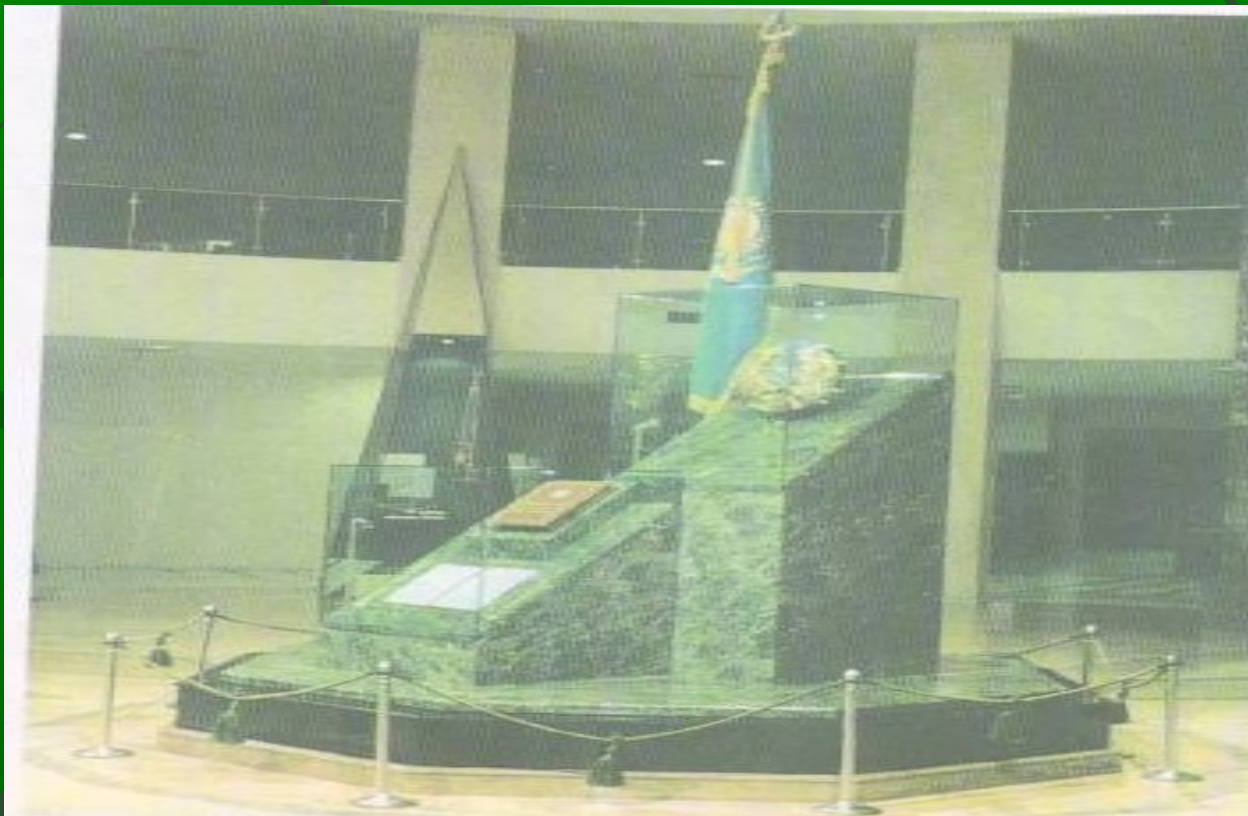
Еліміздің Туы. Елтаңбасы. Әнұраны. Конституциясы қойылған орын. ҚР Президенттік мәдениет орталығы.

1992 жылы 4-маусымда жаңа мемлекеттік рәміздер: Елтаңба, Ту, Әнұраны бекітілді.